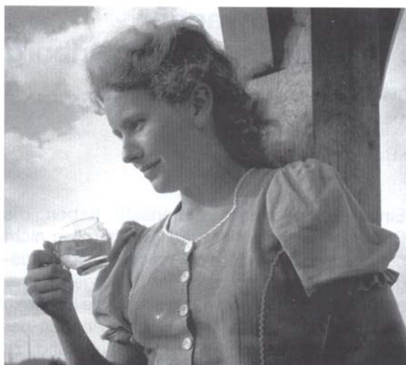
Abb. 5: Mädchen am Bruchhäuser Brunnen, 1950.

wesentliches Merkmal dieser gelungenen Fotografien aus.