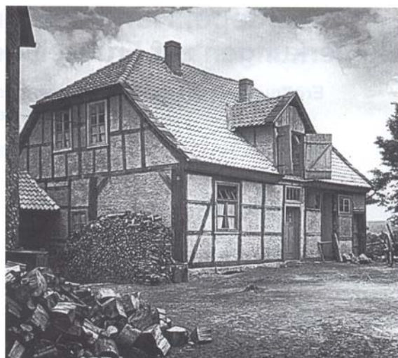
Abb. 6: Hille-Haus in Erwitzen, 1950.