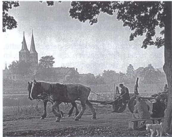
Abb. 4: Floßplatz bei Höxter, 1950.