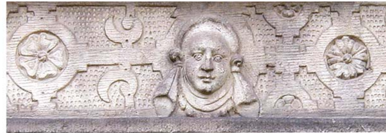
Mit Beschlagwerk und Maske verzierter Fenstersturz von Thienhausen, ein typisches Motiv der Weserrenaissance

Das Bild der Schlossbaukunst innerhalb der Kreisgrenzen ist im wesentlichen geprägt von den bedeutenden Leistungen der Weserrenaissance;