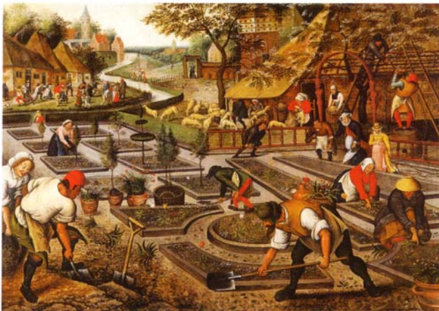
Anlagen eines herrschaftlichen Barockgartens, Gemälde Frühling von Pieter Breughel d.J. von 1616

Den aufwendigen und standesgemäßen Lebensstil, der in diesen Häusern praktiziert wurde, soll beispielhaft ein edler barocker Pokal aus dem ehemaligen Inventar der Hinneburg tradieren. Er stammt aus der nordwestlich von Brakel gelegenen untergegangenen Emdrer Hütte. Diese führende Glashütte des Hochstifts Paderborn belieferte vornehmlich den Kurfürsten von Köln, die Fürstbischöfe von Paderborn und Hildesheim, neben denen auch der örtliche Niederadel als Abnehmer erschien. Der Deckelpokal mit Szenen der Falkenjagd verfeinerte den Trinkgenuss ganz besonders, indem er die fünf Sinne ansprach: Den Tastsinn durch den wohlgeformten Schaft, die Farbigkeit des Weines befriedigte das Auge, der Gläserklang beim Anstoßen das Ohr, der Duft in der Kupa die Nase und schließlich der genießende Schluck die Zunge.