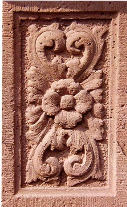
Barockes Füllornament an der Corveyer Schlossbrücke