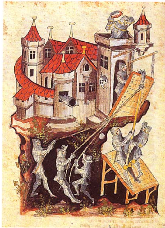
Illustration aus dem ersten deutschen Lehrbuch für Kriegstechnik Belliforis , Vorrichtung zum gewaltsamen Öffnen von Toren, die Gepanzerten müssen sich anhängen und ziehen, 15. Jahrhundert

Blitzschlag oder Kriegszerstörung, aber auch das Aussterben von Adelfamilien führten nicht selten zur Auffassung der Anlagen. Die verlassenen, in der Folgezeit häufig völlig zerfallenen Adelssitze, tragen vielfach nur die Flurbezeichnung oder den Gewannennamen Alte Burg , Herrenburg , Auf der Burg , Borch (Marienburg in Borgentreich), oder ähnliches und können gleichwohl, trotz des Fehlens schriftlicher Zeugnisse, allein aufgrund ihres topographischen Bezugs zu einer nahegelegenen neuen Burg oder Siedlung mit dieser in einen historischen Zusammenhang gebracht werden. Zum intensiven Burgensterben kam es im 15. und 16. Jahrhundert, so dass für die Menschen jener Zeit die Burgruine auf der Bergeshöhe ein recht vertrauter Anblick war. Diese Erscheinung wird durch die zeitgenössische Ikonographie bestätigt, indem diese vermehrt Burgruinen abbildet. Bei Albrecht Dürer und einigen seiner Zeitgenossen ist die Burgruine beispielsweise zum Landschaftsmotiv geworden.