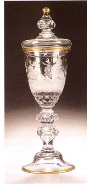
Deckelpokal aus der Emdrer Hütte, um 1750/60, Stadtmuseum Brakel

Der sich ab 1800 verbreitende Klassizismus fand im Adelssitz in unseren Gefilden weniger Widerhall. Als exponierte Beispiele seien jedoch Hainhausen in Brakel, Holzhausen in Nieheim sowie die Burg-Bühne in Borgentreich