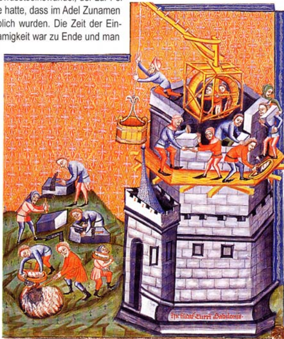
Bau eines Turmes: Steinmetze behauen Quader, Kalk wird gebrannt, ein Auslegekran mit Lauftrad befördert das Material zur Baustelle, Maurer errichten ein Stockwerk, Miniatur aus der Weltchronik genannten gotschen Handschrift von 1383

Mit zunehmender Ausbildung von Territorialherrschaften und örtlichen Gewalten im hohen Mittelalter wurden in wachsender Zahl Burgen zur Absicherung des Hausgutes und Landbesitzes der Feudalherren errichtet. Gleichzeitig entfalteten sich kleinere Herrschaftskreise auf regionaler und lokaler Ebene, und zwar so, dass auf unterschiedlichen sozialen Ebenen mit Hilfe von Waffen Schutz gewährt und der Friede gesichert wurde. Dieses Phänomen war der Ursprung für eine Herrschaft, deren Kristallisationspunkt auf der untersten Ebene der feste Sitz war. Diese räumliche Fixierung bewirkte schließlich auch einen Bewusstseinswandel, der zur Folge hatte, dass im Adel Zunamen üblich wurden. Die Zeit der Einnamigkeit war zu Ende und man