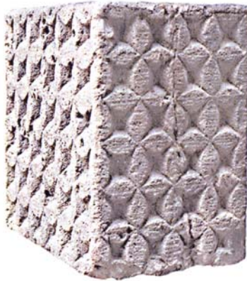
Typisches Bauelement der Weserrenaissance: Kerbschnittquader vom Wehrdener Drosteturm aus der Zeit um 1615

vom bewohnbaren Wehrbau zum wehrhaften Wohnbau über.